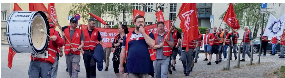
Zweiter Warnstreik am 20. Mai

KLEIN, ABER MIT BETRIEBSRAT: TELETEK GMBH