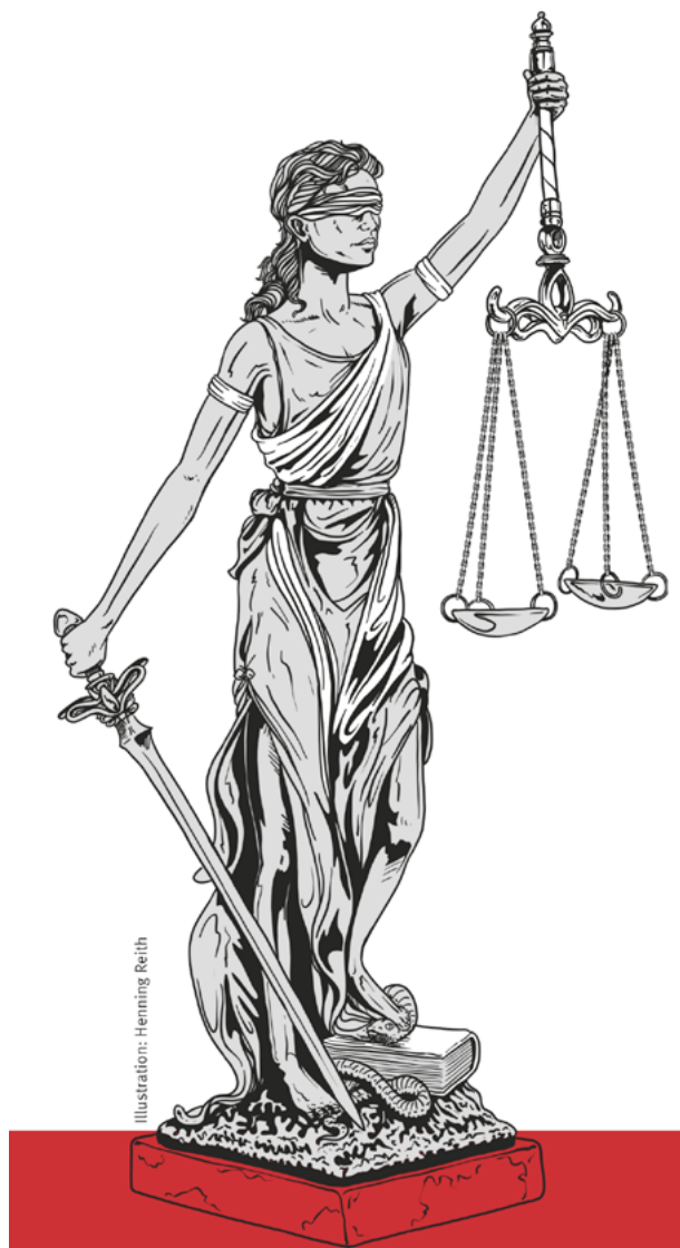
Illustration: Henning Reith

Was bedeuten J45.0 oder J45.1 auf der Krankmeldung? Um Krankheiten einheitlich zu dokumentieren, müssen Ärztinnen und Ärzte diese Codes, sogenannte ICD-Codes, weltweit in der ambulanten Versorgung verwenden. ICD steht für »International Statistical Classification of Diseases and Related Health Problems«, zu Deutsch und vereinfacht: »Internationale Klassifikation der Krankheiten«.