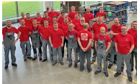
Aktive Metaller und Metallerrinnen